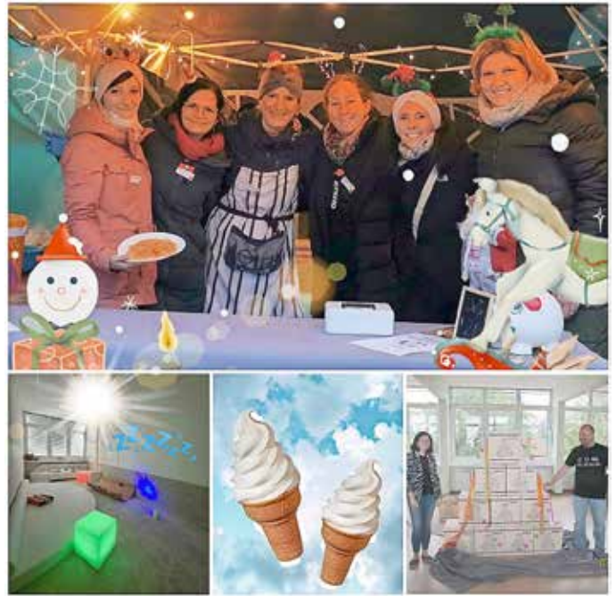
Herzliche Grüße Ihr Förderverein Zukünftige Entdecker Neukieritzsch e.V.

Wir danken Ihnen für Ihre/eure Unterstützung und Engagement. Gemeinsam werden wir auch im neuen Jahr weiterhin spannende Projekte für unsere Kinder realisieren. Auf ein erfolgreiches Jahr 2025!